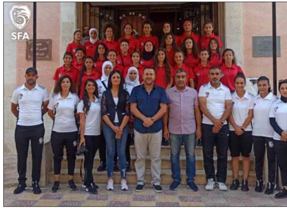
بطولة غرب آسيا للسيدات من 29 آب ولغاية 6 أيلول القادم. الكادر الفني والإداري للفريق

يخوض منتخبنا الوطني للسيدات بكرة القدم معسكراً تدريبياً خارجياً في لبنان يستمر حتى الخامس عشر من شهر آب الحالي.